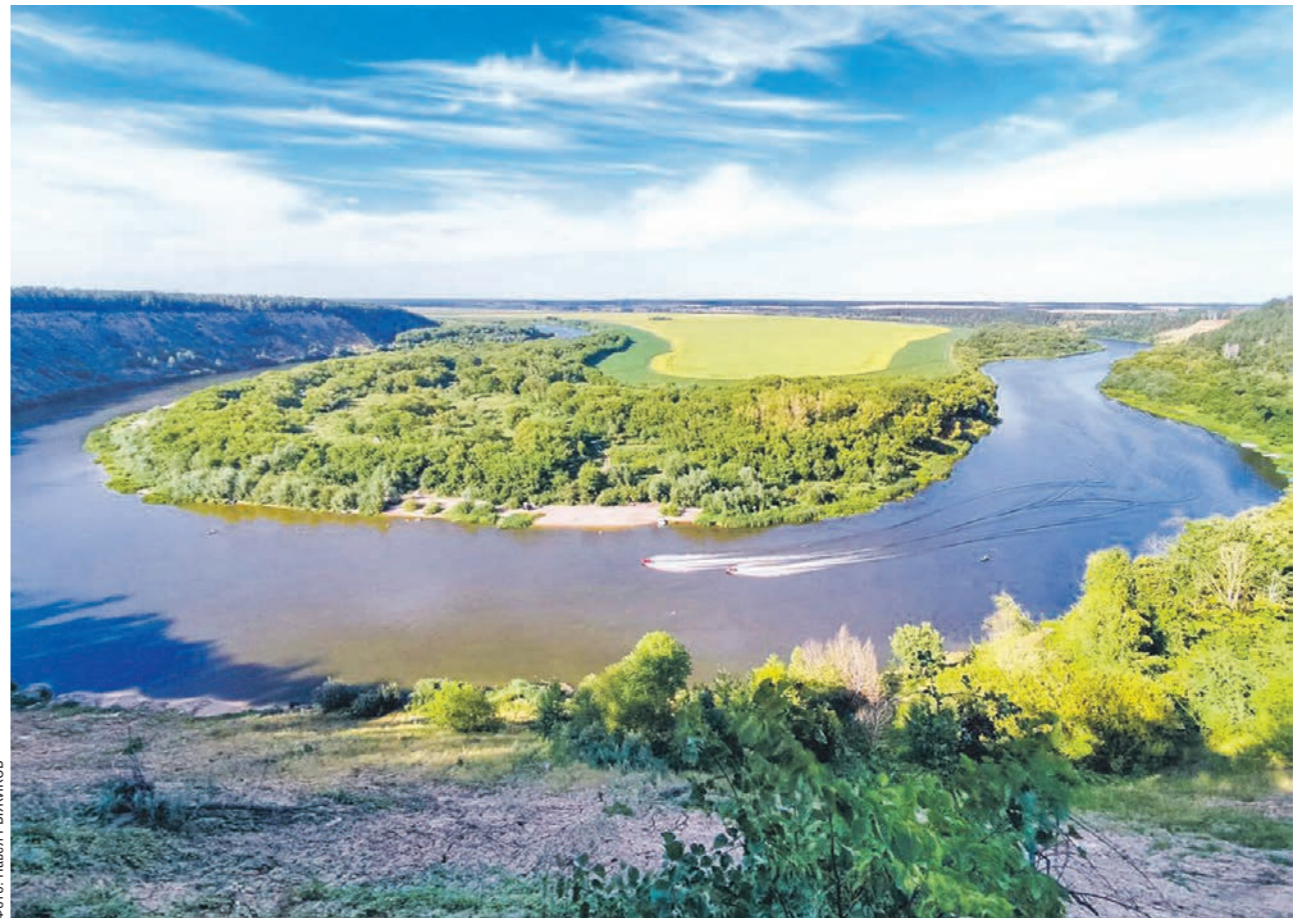
Расчистка притоков Дона поможет оздоровить главную реку Воронежской области

— В прошлом году мы начали расчистку реки Тавровка на территории Воронежа, но вынуждены были приостановить работы и скорректировать проект. Дело в том, что река протекает прямо по границе садоводческого некоммерческого товарищества. Когда мы начали расчищать Тавровку, то оттуда пришлось доставать в огромном количестве строительный мусор и всевозможные виды отходов. Берега также были завалены хламом и растительными остатками. Мусор, ботва, обрезки деревьев — всё сносило к реке. Тот объём отходов, который был рассчитан проектировщиками, оказался в разы меньше, чем было по факту. Под-