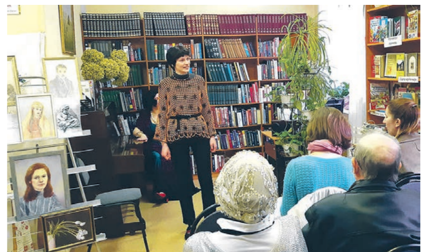
В память о встрече Жуковского и Кольцова в воронежской библиотеке №2 прошла «литературная гостиная»