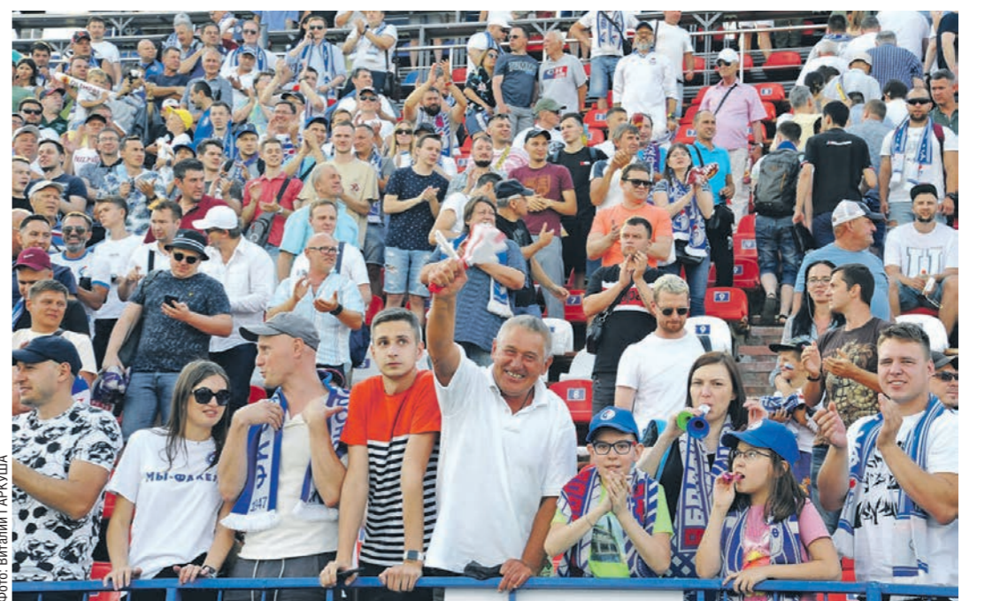
Поддержать любимую команду собралось около 20 тысяч болельщиков

Всю игру вместе с болельщиками на трибунах находился губернатор Воронежской области Александр Гусев, и он также стоя приветствовал команду после финального свистка, скандируя: «Молодцы!».