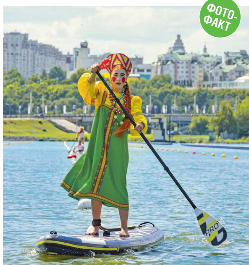
В День Военно-морского флота в Воронеже у дамбы Чернавского моста прошла Петровская регата. Программа включала гонки на лодках-драконах и сапах. А самым запоминающимся эпизодом регаты стал костюмированный заплыв