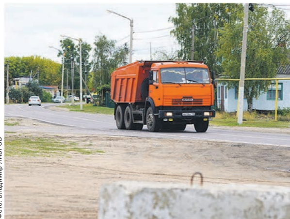
Создание автоматических пунктов весогабаритного контроля повысит безопасность дорожного движения

Новый «бережливый проект» поможет усовершенствовать систему весового контроля в Воронежской области