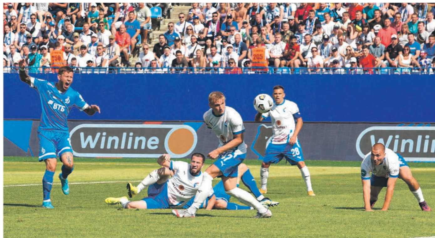
Во время матча в Воронеже эмоции и на поле, и на трибунах зашкаливали

Безоговорочным фаворитом встречи считался московский клуб, однако воронежцы продемонстрировали бойцовский характер и не уступили гостям из столицы