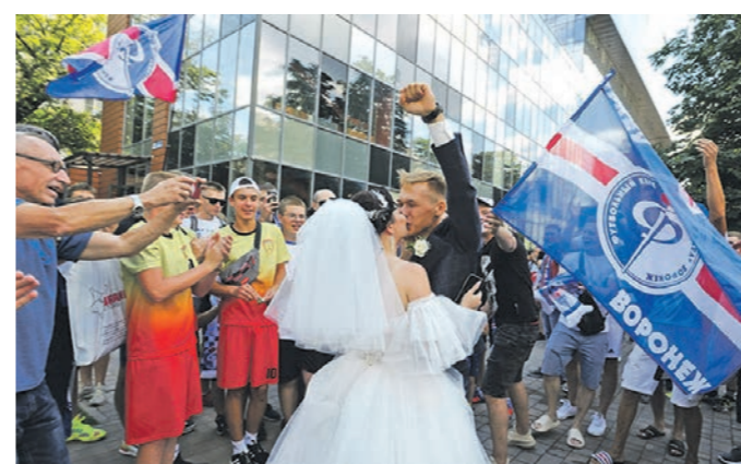
С милым рай и на трибуне!