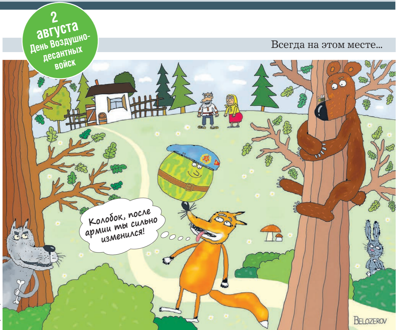
Рисунок Сергея БЕЛОЗЕРОВА

На Петербургском экономическом форуме министр экономического развития Максим Решетников предупредил об угрозе развития в стране дефляции. Прогноз подтвердили данные Росстата. Потребительские цены в июне упали на 0,35% по сравнению с маем. Впервые в истории современной России наблюдается дефляционный процесс. Чем это грозит обычному потребителю?