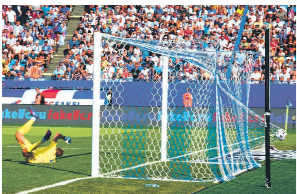
Воронежцы сравняли счёт за 4 минуты до конца основного времени матча