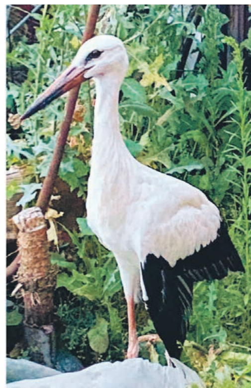
Благодаря неравнодушным воронежцам раненый аистёнок отправился на лечение в Санкт-Петербург