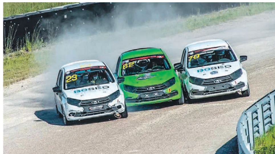
Острых ощущений автогонщику хватает на трассе, поэтому вне её он водит осторожно

Кто-то обладал более агрессивным стилем вождения — старался подогнать, оттолкнуть. Я такого себе поначалу не позволял.