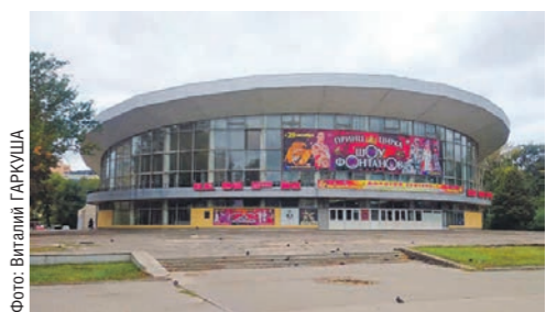
В здании цирка не только обновят интерьеры, но и расширят зону для содержания животных

Реконструкция Воронежского госцирка завершится к концу 2024 года. На проведение работ потратят более 1,7 млрд рублей.