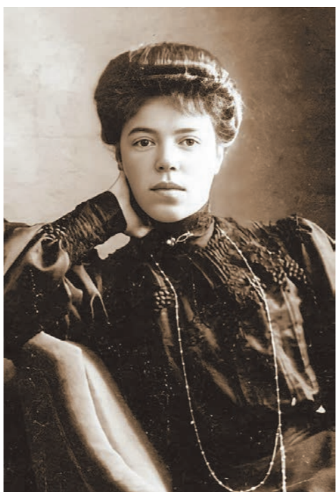
На выставке во Дворце Ольденбургских представлены личные вещи, письма и картины великой княгини Ольги Александровны