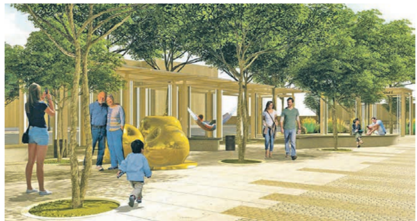
Проект комплексного благоустройства привокзальной площади в Россоши стал уже третьей заявкой на конкурс Минстроя РФ от райцентра

игранных грантов) достиг 1 млрд 120 млн рублей. По постановлению правительства конкурс продлили до 2030 года. Это означает, что мы по-прежнему будем стремиться к тому, чтобы наши малые города становились победителями и появлялись новые современные общественные пространства.