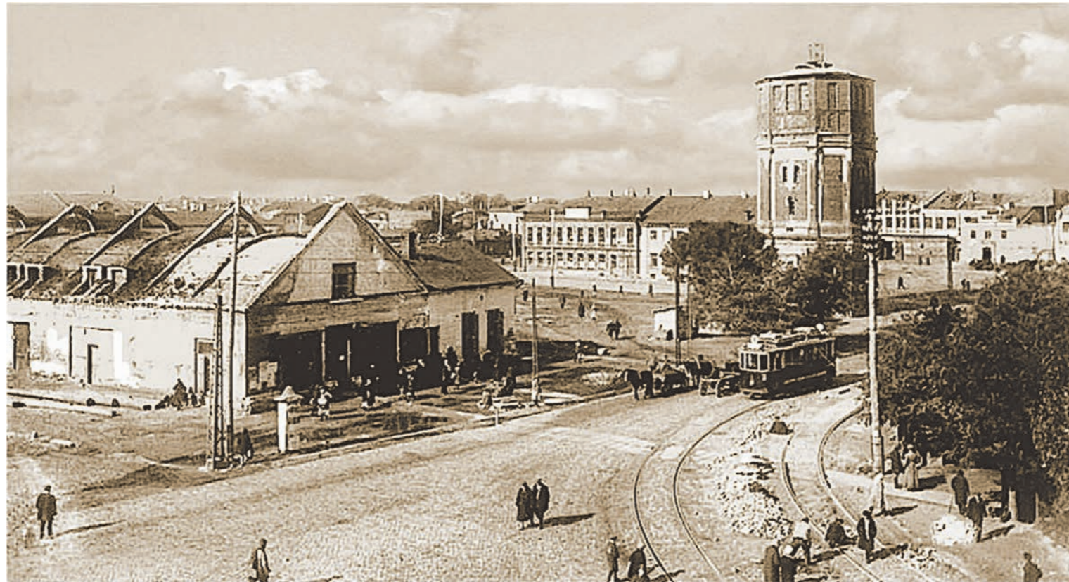
Первый стационарный цирк в Воронеже был построен на Староконной площади (совр. пл. Ленина)

Он шёл по городу и с удивлением разглядывал всё, что ему встречалось на пути. Вот вокруг часовни Митрофановского монастыря (сейчас там расположен главный корпус ВГУ) целое столпотворение – толкучий ры-