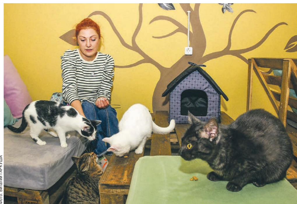
Воронежский мьяурум рассчитан на 15 пушистых обитателей

ла в Россию из Белоруссии. Её спасли московские волонтеры из белорусской усыпальницы — места, где бездомным животным проводят эвтаназию. А уже из столицы Карамельку забрали воронежские активисты.