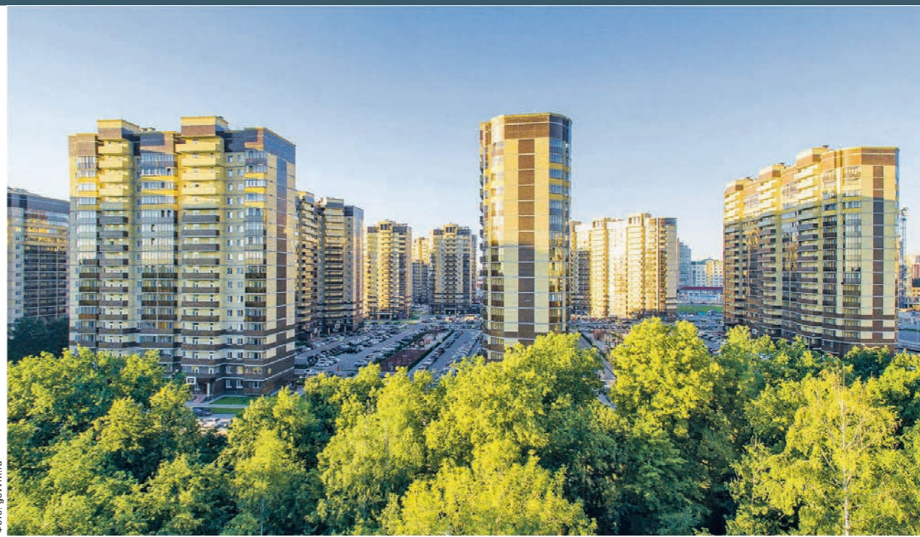
Комфортность среды проживания и жилищная обеспеченность населения — приоритеты градостроительной политики региона