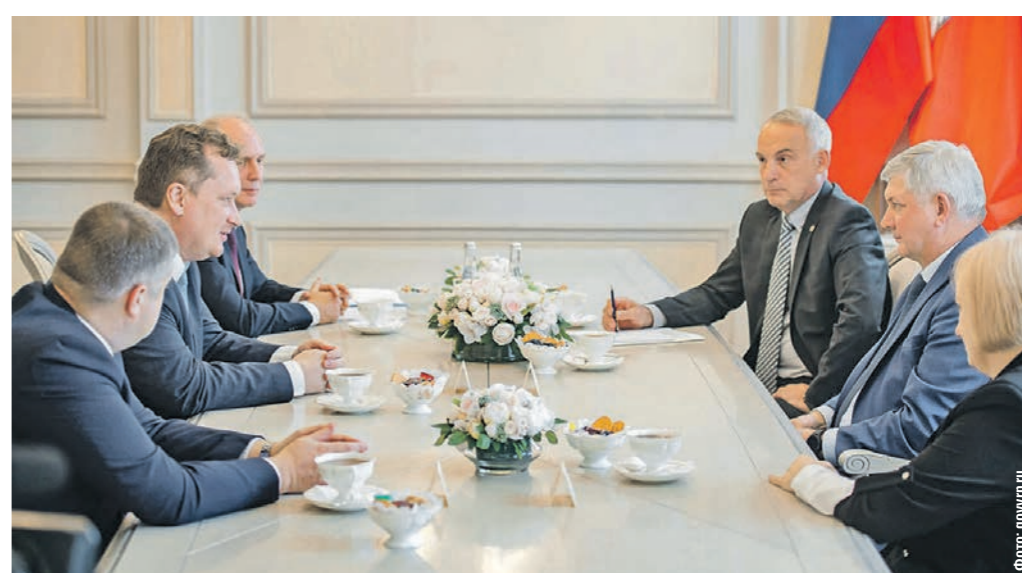
По словам губернатора Александра Гусева, Воронежская область продолжит активно участвовать в подготовке управленческих кадров

Культурные и патриотические темы — самые популярные. История и культура — это то, что в первую очередь нас объединяет.