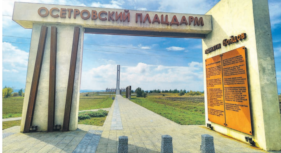
Действия наших бойцов во время Среднедонской наступательной операции стали символом беспримерного мужества для будущих поколений

У тром 16 декабря 1942 года перешли в наступление войска 1-й гвардейской и 6-й армий, в составе которых были 1-я, 35-я, 41-я и 44-я стрелковые дивизии, а также 17-й и 25-й танковые корпуса, наступавшие непосредственно с Осетровского плацдарма и ближайших к нему участков фронта... Так историки описывают начало операции «Малый Сатурн», 80-летие которой в Воронежской области отмечают в этом году. Тогда победа наших войск привела к коренному изменению обстановки на Сталинградско-Ростовском направлении и на всём советско-германском фронте. О героях, которые пожертвовали собой ради освобождения родной земли, — в материале «Коммуны».