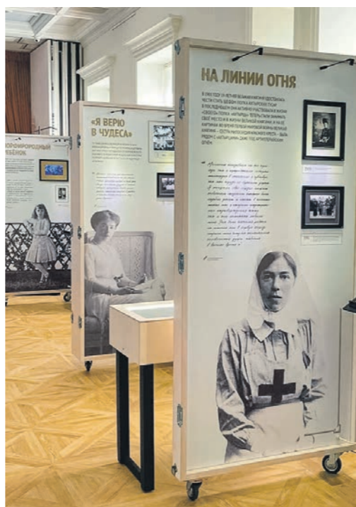
На выставке во Дворце Ольденбургских представлены личные вещи, письма и картины великой княгини Ольги Александровны

Главная страсть Ольги – рисование. Вот как она об этом пишет: «Уже с самого раннего возраста я стала интересоваться искусством во всех его видах, особенно живописью. Даже во время уроков географии и арифметики мне разрешалось сидеть с карандашом в руке, потому что я лучше слушала, когда рисовала кукурузу или дикие цветы».