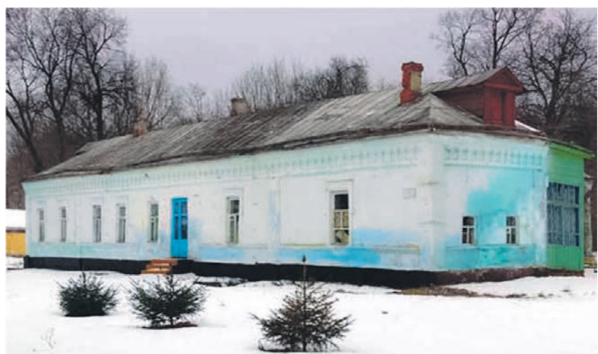
Барский дом на хуторе Эртель (бывшая Эртелевка)